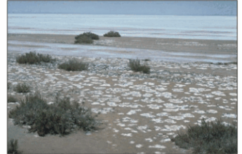
Paysage actuel de sebkha (El Melah, Tunisie). Les taches blanches sont des efflorescences de sel sur un substratum riche en gypse.